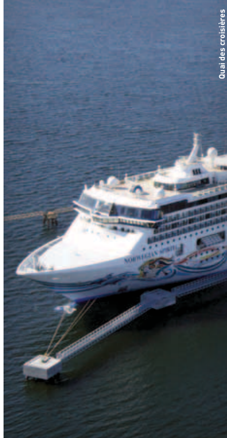
Quai des croisières