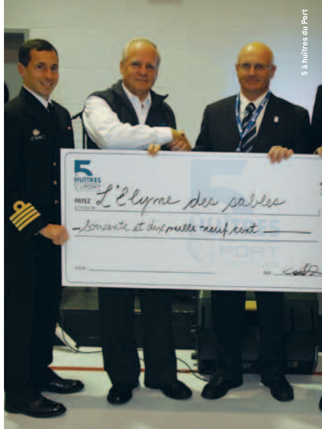
5 à huîtres du Port