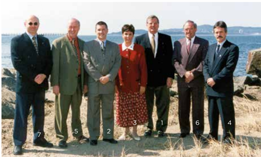
1999 | Membres du premier conseil d'administration