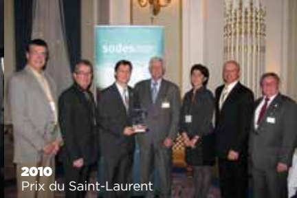
2010 Prix du Saint-Laurent

Le Port de Sept-Îles poursuit l'intégration de sa démarche de développement durable à ses activités courantes. Pour ce faire, le poste de gestionnaire en environnement a été créé afin de faire face aux défis grandissants liés au développement des infrastructures du Port. Sa participation au programme de l'Alliance verte lui permet de réduire son empreinte environnementale en adoptant des mesures concrètes et évaluables. L'amélioration constante de la performance environnementale passe par la mise en œuvre de son système de gestion environnementale (SGE) débutée en 2013. L'identification de cibles à atteindre et d'actions concrètes pour y parvenir sert de balise lui permettant de consommer et de gérer les matières résiduelles de façon écoresponsable et d'apprécier les résultats obtenus à l'aide d'indicateurs.