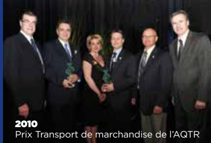
2010 Prix Transport de marchandise de l'AQTR